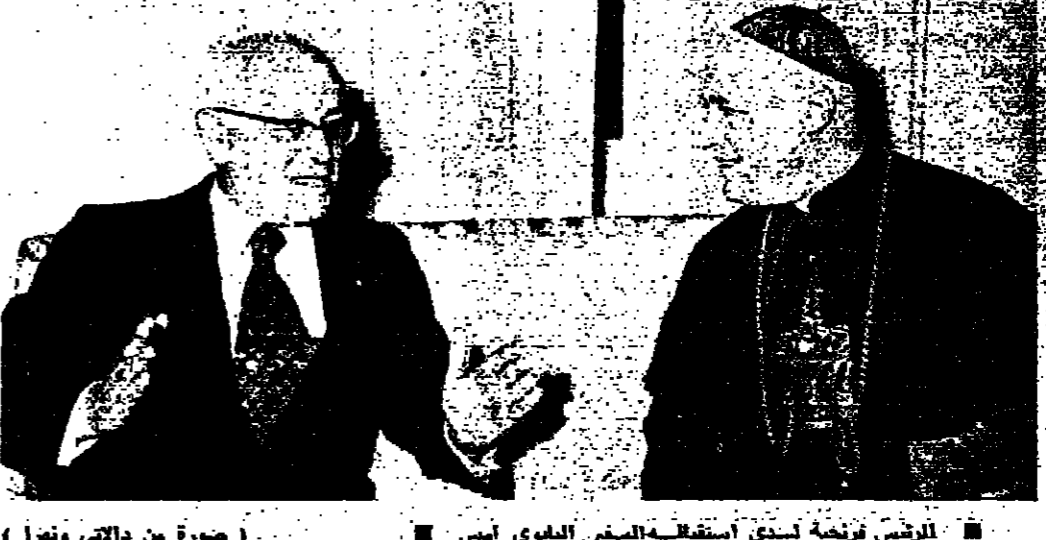
الرئيس فرنجية يستقبل استغاثه السفير البابوي امس .

قال السفير البابوي في لبنان الاستاذ الفريدو برونيا ، رسالة من البابا بولس الى الرئيس سليمان فرنجية امس ، يؤكد فيها اهتمامه وعبره عن الامل وان يحل القضايا تقضاياهم ليقيم لبنان مركزا للحوار . وقال السفير برونيا بعد مقابلة الرئيس فرنجية التي استمرت ٥٥ دقيقة : كما تطولون ، ان قداسة البابا بولس السادس لا يمتنع ان يبقى غير حيال بكل ما يتعلق باحداث لبنان وأنها يتفرس لبنان لاملات ومشاكله فان قداسة يسكن كل اللبنانيين والاهم وتقدم . واضاف يقول : ان البابا ينظر الى لبنان كامل لكل الشرق الاوسط والاذني لانه مركز للحوار ، ونموذج للتعايش السلامي بين مواطنين ينتمون الى عقائد وديانة مختلفة . وقال السفير البابوي : لقد نقلت رسالة من قداسة البابا الى الرئيس فرنجية يؤكد فيها اهتمامه بالاحداث التي مرت بلبنان ، كما يعرب عن امله في ان يمد كل اللبنانيين الى حل - البقية على الصفحة ٥ -